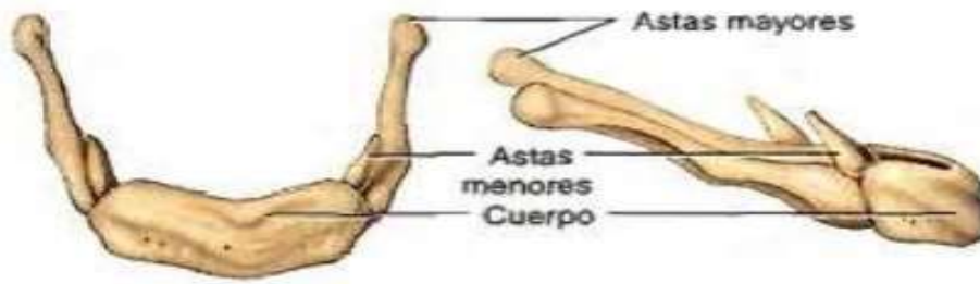
(b) Vista anterior